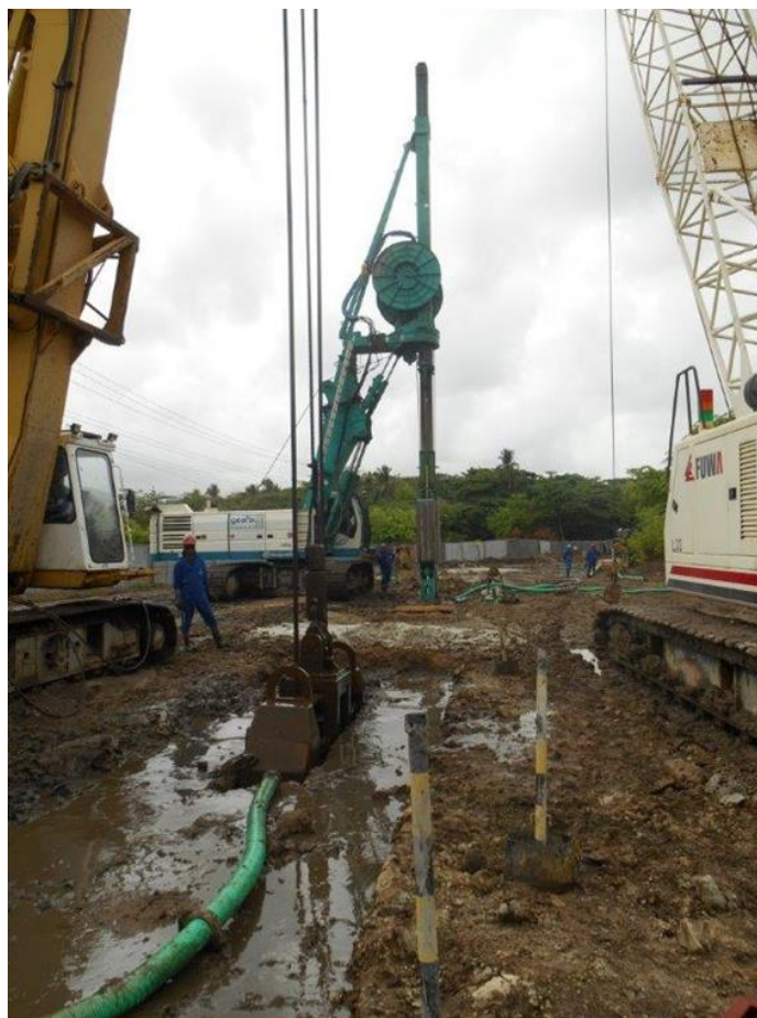
Figura 8. Execução da escavação da parede diafragma plástica

Após a instalação do canteiro de obras e montagem dos equipamentos, iniciou-se a execução do trecho interno do Tramo 1, seguindo para o trecho externo do mesmo tramo e retornando novamente a parte interna da indústria para finalização. Na sequência foi realizada a execução do tramo 2 para isolamento definitivo dos 3 (três) tanques de dicloroetano.