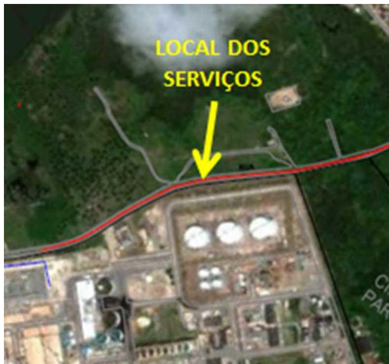
Figura 2. Local dos serviços