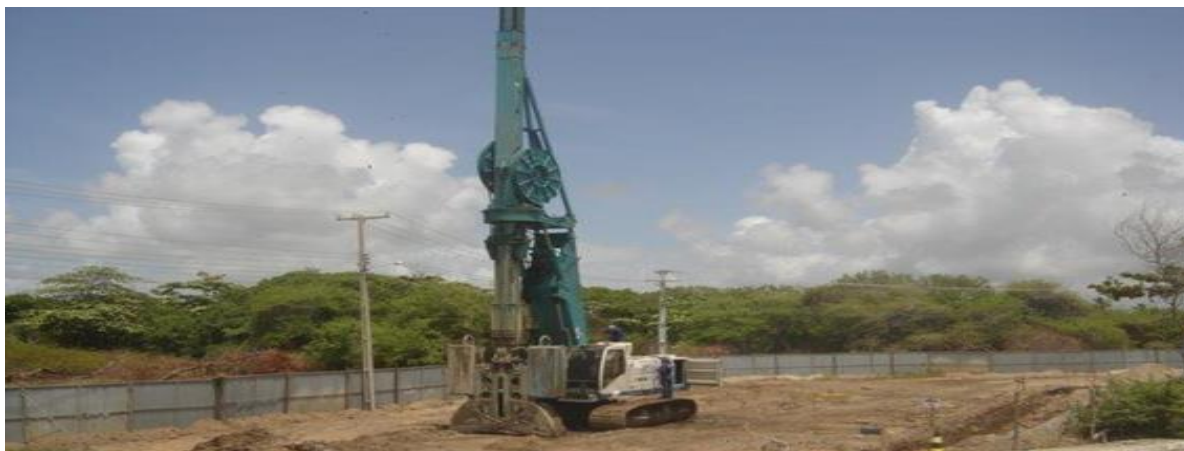
Figura 7. Diafragmadora hidráulica no local da obra.