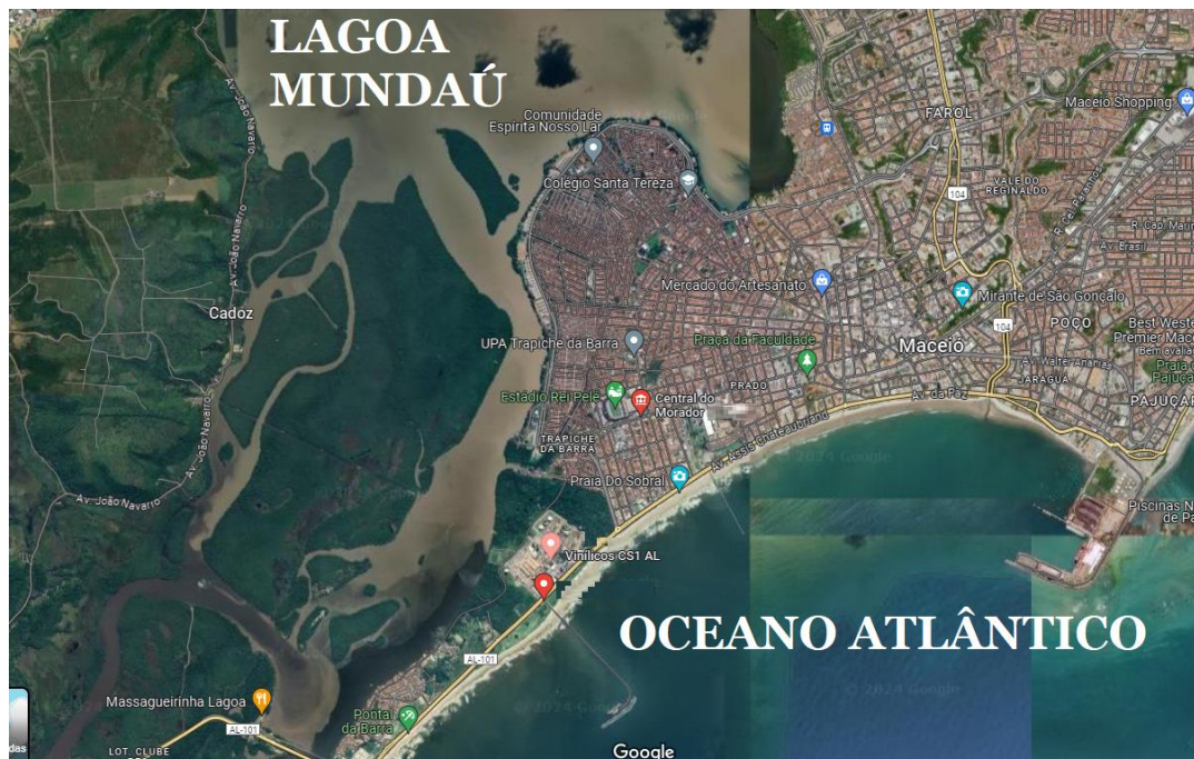
Figura 1. Local da obra

O local tinha aproximadamente 21.500 m 2 de área de canteiro de obras, onde foi projetada uma contenção em parede diafragma plástica com perímetro 489,40 m para isolamento de fluido químico contaminante. A área de contenção foi de 6.756,16 m 2 com espessura de 60 cm e profundidade de escavação entre 13 e 15 m. A obra teve início em 11 de novembro de 2013 e terminou em 15 de maio de 2014.