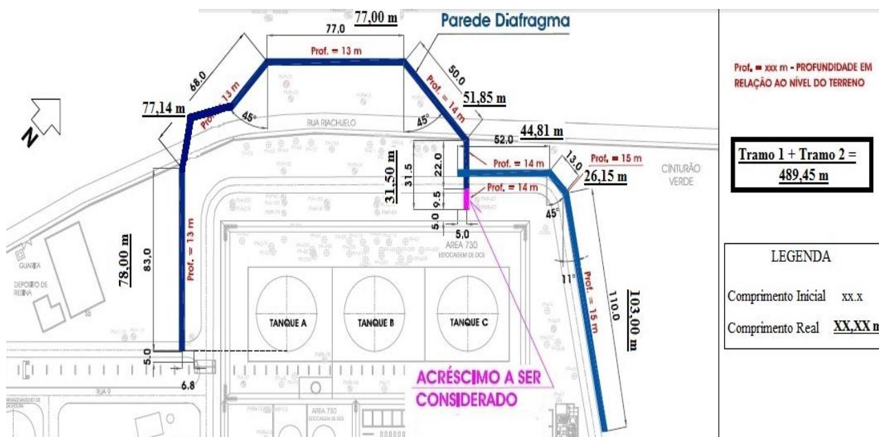
Figura 6. Projeto As Built

Conforme projeto “as built” apresentado na figura 6 a seguir, a parede foi subdividida em dois tramos para facilitar a ordem e prioridade de execução. O tramo 2, portanto, foi executado somente após a conclusão do primeiro e penetrou 5 m perpendicularmente através da lamela já construída do tramo 1. O tramo 1 foi construído com perímetro de 315,49 m e tramo 2 com 173,96 m, totalizando em 489,45 m de perímetro de parede diafragma ao redor dos três tanques de dicloroetano, onde um dos tanques apresentou vazamento.