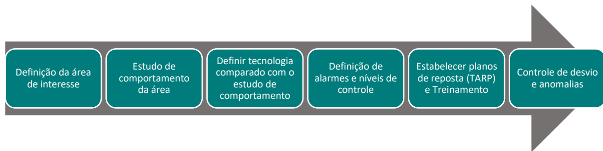
Figura 1: Fluxo estruturante para monitoramento geotécnico (Autor, 2023).

O primeiro passo é a definição da área ou local a ser monitorado, os monitoramentos podem ser em áreas específicas ou até mesmo em toda a estrutura. A inspeção de campo é uma excelente forma para definição da área de interesse, além de uma abordagem crítica sobre anomalias visuais como trincas, rachaduras, abatimentos entre outros.