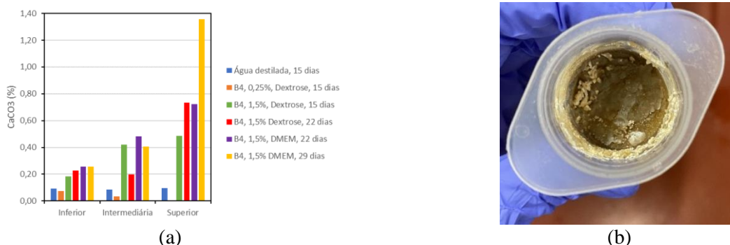
Figura 3. (a) Distribuição de \text{CaCO}_3 nas diferentes camadas da amostra, e (b) Presença de biofilme na parte superior de uma amostra tratada durante 22 dias com B4 a 1,5% e uso de DMEM.

pequenas (inferiores a 6g) e submetendo-as à temperaturas de 550°C e 950°C durante períodos de 5 e 3 horas, respectivamente, visando maximizar a precisão do ensaio.