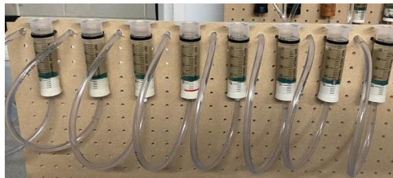
Figura 1. Setup das amostras montado

Amostras de solo de uma areia padrão foram compactadas em seringas de 60 ml, em 3 diferentes camadas, na qual cada camada continha 17 g de solo, ocupando um volume de aproximadamente 10 ml. Para a confecção do setup Figura 1, a parte inferior das seringas foi cortada e, com auxílio de rolhas de borracha, a parte inferior das seringas foi devidamente vedada. As rolhas possuíam um furo central, permitindo o encaixe de um tubo capaz de realizar a drenagem de líquidos do sistema. Além disso, entre a rolha de borracha e a amostra de solo, havia uma camada de fibra abrasiva e outra de papel filtro, para evitar passagem de areia da seringa para o tubo durante a percolação de soluções (Roth et al., 2022).