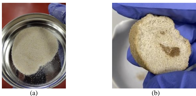
Figura 4. Comparação entre as amostras tratadas, durante 29 dias, com (a) água destilada e (b) B4 a 1,5% e uso de DMEM.

No entanto, ainda que a técnica utilizada esteja sob escrutínio e o percentual máximo de \text{CaCO}_3 precipitado com o tratamento indicado por este ensaio seja de apenas 1,36%, observa-se visualmente que as amostras tratadas com a solução B4 a 1,5% não desagregam facilmente. De fato, após o tratamento e a secagem na estufa à 105°C por 24 horas, enquanto as amostras com água destilada se desagregaram (Figura 4a), as amostras tratadas com a solução de enriquecimento permaneceram com o formato cilíndrico, precisando de uma leve pressão para serem desagregadas (Figura 4b).