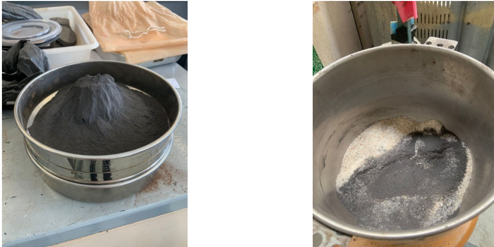
Figura 1. (a) Rejeito e Mineração utilizado, (b) Uma das misturas rejeito-solo

os materiais utilizados nesta investigação, sendo (a) o rejeito da mineração de ferro e (b) uma das misturas rejeito-solo utilizadas na pesquisa.