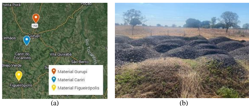
Figura 2. Pontos de coleta: a) localização dos pontos; b) depósito de Cariri do Tocantins.

Inicialmente, foi feita a análise visual e, posteriormente, foi feita a redução das amostras para os ensaios de laboratório, utilizando o método de quarteamento, de acordo com os procedimentos da norma DNER – PRO 199/96 (DNER, 1996).