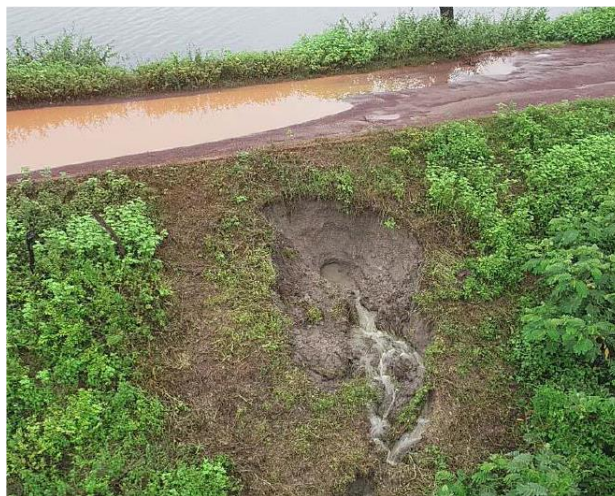
Figura 2. Surgência indicando erosão tubular regressiva, talude de jusante.

A evolução da surgência se deu com fluxo constante de água barrenta e rupturas localizadas sucessivas, revelando o elevado gradiente hidráulico naquele ponto, bem como fraturamento hidráulico provocando a erosão. Todas essas características, observadas na Figura 2, permitem confirmar que o fenômeno ocorrido na barragem do Bezerro tratou-se de uma erosão tubular regressiva, ou seja, um entubamento. Os mecanismos atuantes nesse incidente são a percolação e a erosão.