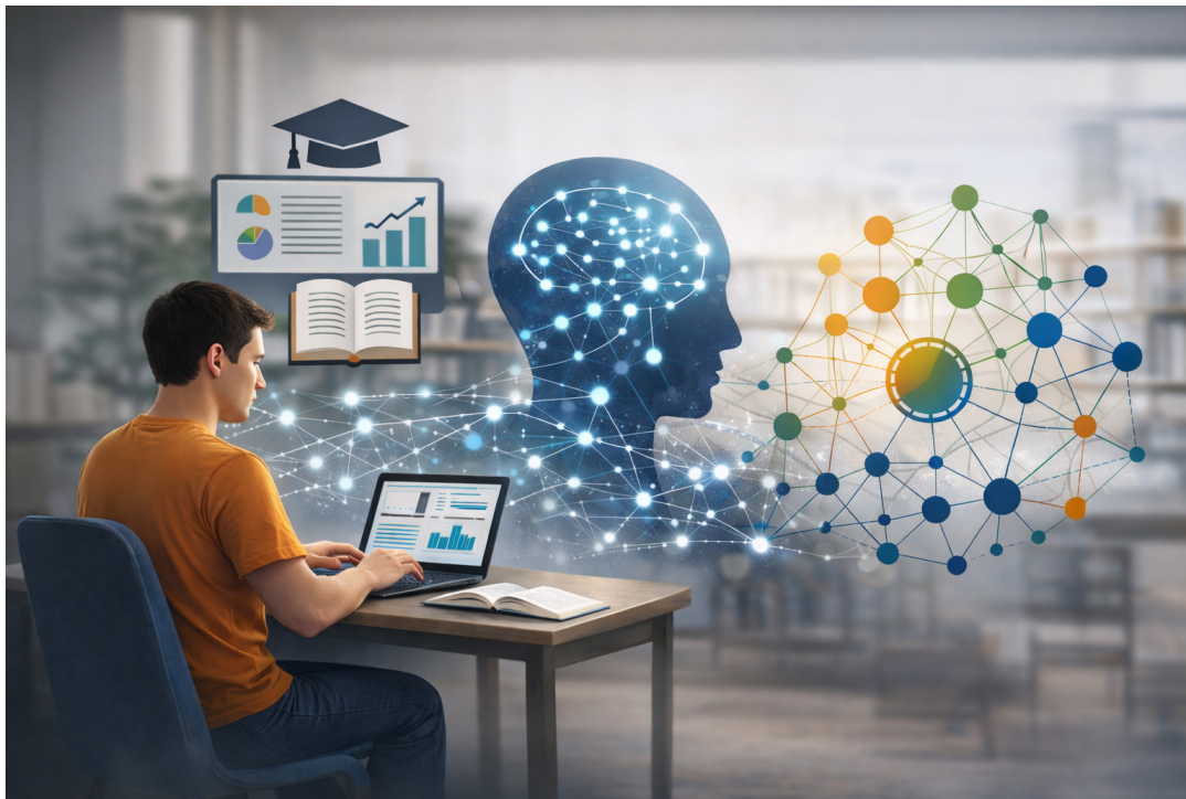
Figura 1: ilustração da integração da inteligência artificial nos processos educacionais.