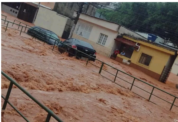
Figura 1: Transbordamento do córrego Ipiranga e alagamento da Avenida Ibitiguaia no ano de 2023.

Apesar de sua grande importância no cenário comercial da cidade, os episódios de alagamentos e inundações do bairro Santa Luzia se repetem pelos anos, causando prejuízos e afetando a vida da população da região. Segundo Floriano e Bernadete (2023), as chuvas do verão de 2023 causaram terror nos moradores do bairro, deixando duas pessoas ilhadas e uma família presa em sua residência, a qual só foi resgatada com auxílio do corpo de bombeiros. As ocorrências foram expostas nos principais jornais da cidade, contendo relatos dos moradores bem como as fotografias registradas (Figura 1). Em 2021, o mesmo fenômeno aconteceu, deixando um rastro de lama por onde a correnteza resultante do transbordamento do córrego se alastrou, impactando comerciantes e lojistas da região pelas perdas materiais causadas (ARAÚJO, 2021).