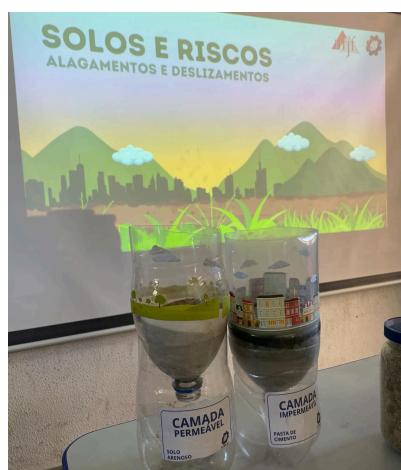
Figura 3. Modelo físico utilizado em sala de aula.

Ainda no primeiro encontro com os alunos, foi levado um modelo físico que demonstra conceitos de permeabilidade, comparando o comportamento do solo com o do concreto na presença de água da chuva. Para esse modelo físico, foram utilizadas duas garrafas pet transparentes. Em ambas, foi inserido um pouco de solo predominantemente arenoso, mas, em apenas uma, foi adicionada ainda uma camada de pasta de argamassa (cimento e água), para simular o comportamento de permeabilidade do concreto (Figura 3). No momento com os alunos, a mesma quantidade de água foi despejada sobre cada uma das garrafas, simulando a chuva em diferentes tipos de solo, de forma a fazê-los compreender que, em locais urbanos com camadas de asfalto e de concreto, a água é incapaz de se infiltrar e se acumula nas ruas da cidade. Em contrapartida, é possível observar que em solos expostos, como em áreas rurais, a água consegue percolar com maior facilidade, evitando a ocorrência de alagamentos, sendo demonstrada a importância de preservar as áreas verdes em meio aos grandes centros urbanos.