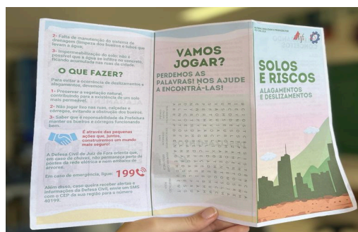
Figura 4. Folheto em formato de cartilha com informações a respeito de alagamentos e inundações.

Depois de sete dias, a escola foi novamente visitada. Desta vez, ocorreu uma conversa guiada com os alunos, buscando aprimorar os conhecimentos sobre os conceitos apresentados no encontro anterior e retirando algumas dúvidas que surgiram durante esse período. Após isso, foi aplicado o mesmo questionário do primeiro dia, sendo possível perceber o impacto causado pelo trabalho na aquisição de conhecimento das crianças e, para finalizar, os alunos receberam uma cartilha, exposta em formato de folheto (Figura 4).