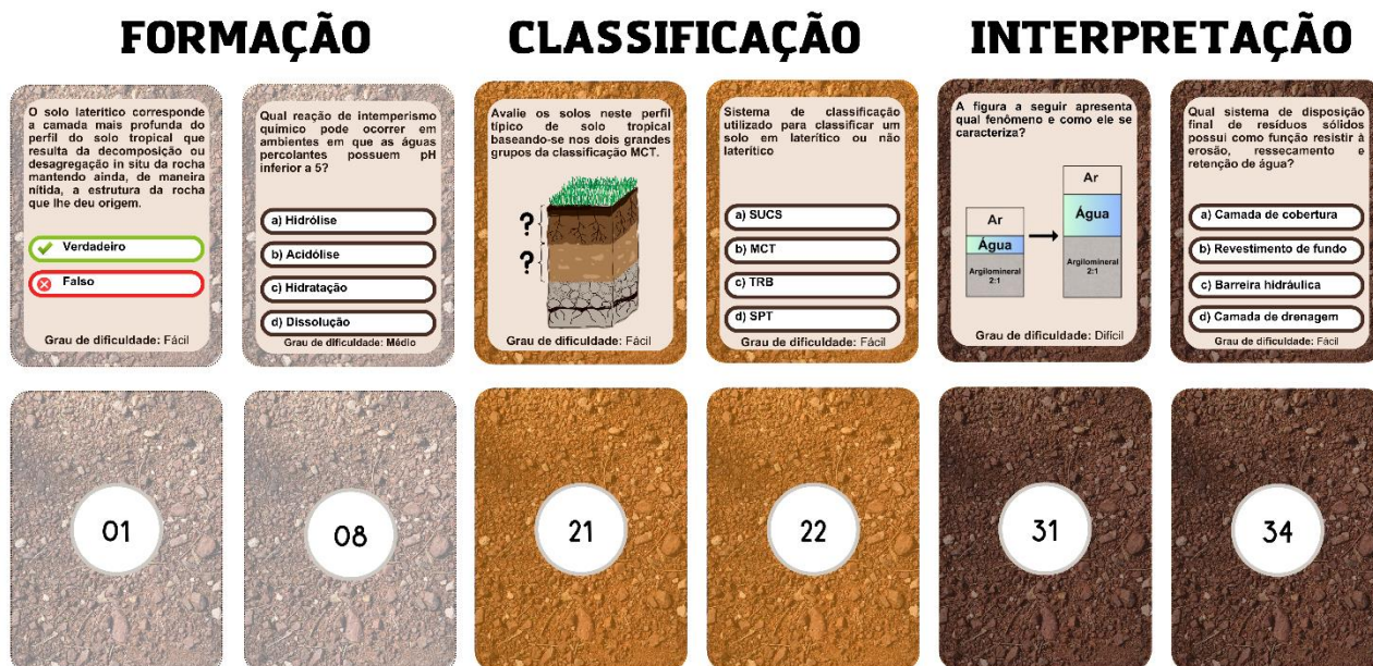
Figura 2. Modelo de cartas.

uma, duas ou três casas no tabuleiro, respectivamente. A fim de garantir a jogabilidade foram elaboradas doze questões fáceis, quinze médias e oito difíceis. Caso o discente ou grupo não acerte a resposta, ele não avançará no tabuleiro, sendo necessário tentar novamente na próxima rodada; O grupo ganhador será o que completar o percurso primeiro, chegando a casa “FIM”.