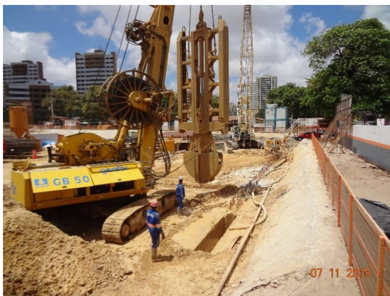
Figura 3. Execução da contenção de parede diafragma com utilização do Clam-Shell no empreendimento (Autor, 2015)

Para o atirantamento foram executados 418 unidades de tirantes provisórios, de cordoalhas, com carga de trabalho até 150 toneladas-força.