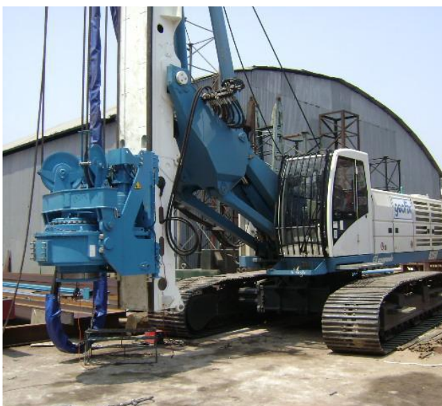
Figura 4. Equipamento perfuratriz utilizado para execução de pré-furo

Esta configuração para execução, desde o tipo de maquinário a ser utilizado até o tipo de ponta do trado e distribuição dos furos, foi definida pela empresa responsável pela atividade, dado o conhecimento técnico da mesma para lidar com este tipo de situação com presença de arenito. Importante salientar que este tipo de conhecimento é puramente empírico e desenvolvido a partir das experiências da empresa na execução sobre os diversos tipos de solos e rochas e nas suas relações com os projetistas geotécnicos.