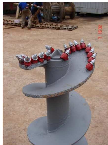
Figura 5. Ponteira de trado para execução de pré-furo (Autor, 2015)