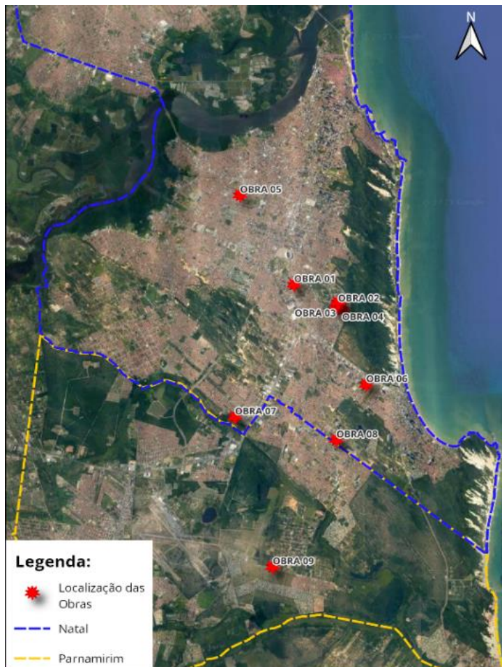
Figura 1. Localização das obras

A obra 09 apresenta suas camadas de forma homogênea, possuindo uma fina camada de areia na superfície, seguida por areia argilosa e aos 14,0 metros uma grande camada de areia argilosa avermelhada e com pedregulhos.