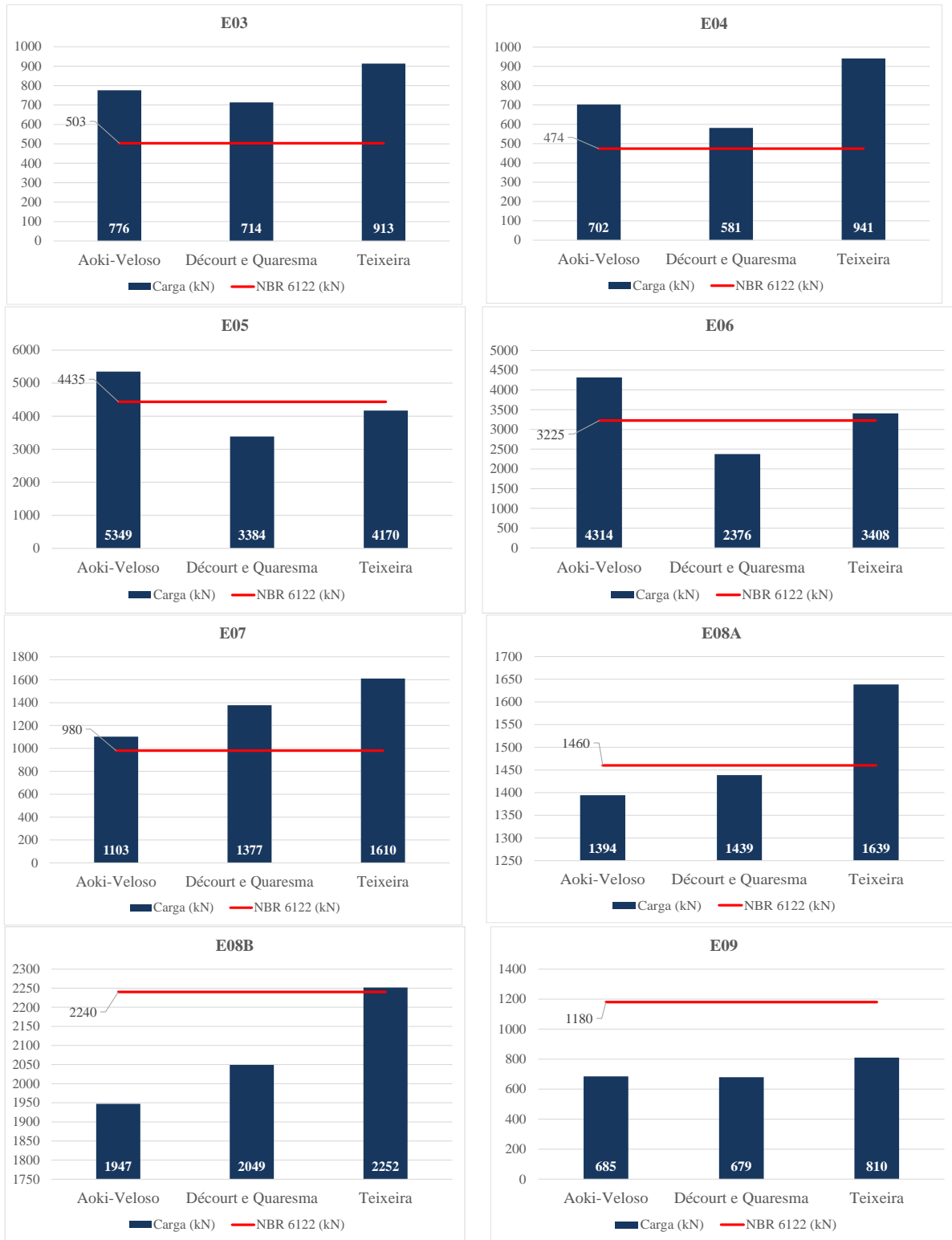
Figura 2. Estimativas de carga de ruptura das estacas E01 a E09

Na Tabela 5 , está descrita a relação entre a profundidade executada da estaca e as características dos seus respectivos solos.