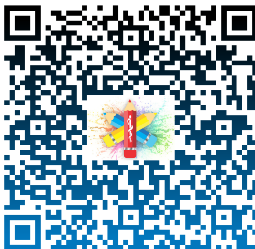
Imagem 3: QRCode para acesso ao e-book sobre primeiros socorros. Manaus- AM, 2021.

Visto que o país ainda se encontra em um cenário pandêmico, foi criado um perfil no Instagram (@sbvnascolas_), por ser um veículo de mídias sociais que possui um grande impacto sobre a população, a fim de divulgar o e-book, e levar conhecimento sobre SBV para o maior número de pessoas.