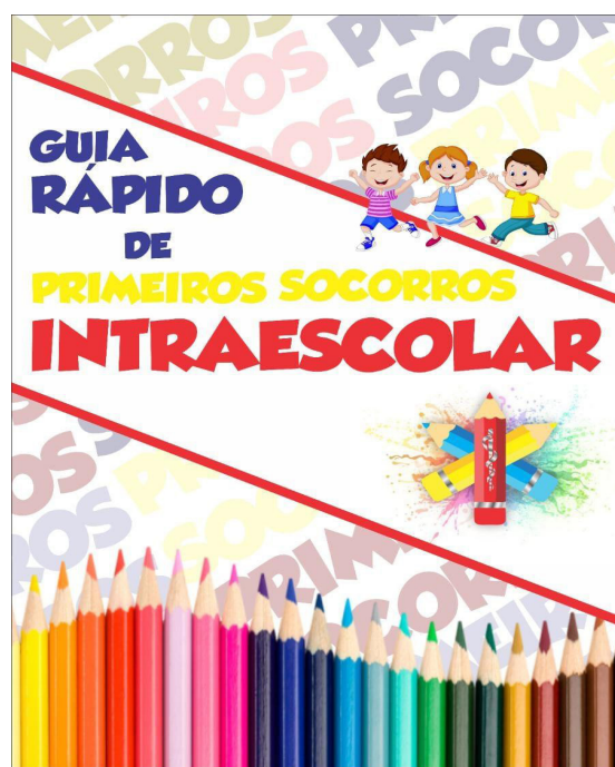
Imagem 2: Capa do e-book. Manaus, AM, Brasil, 2021.

Todo o processo de edição do e-book foi feito por meio do programa Coreldraw 2019, sendo composta por 34 páginas contendo capa, contra capa, sumário, apresentação, desenvolvimento e referências bibliográficas. A capa pode ser identificada na imagem abaixo (Imagem 2).