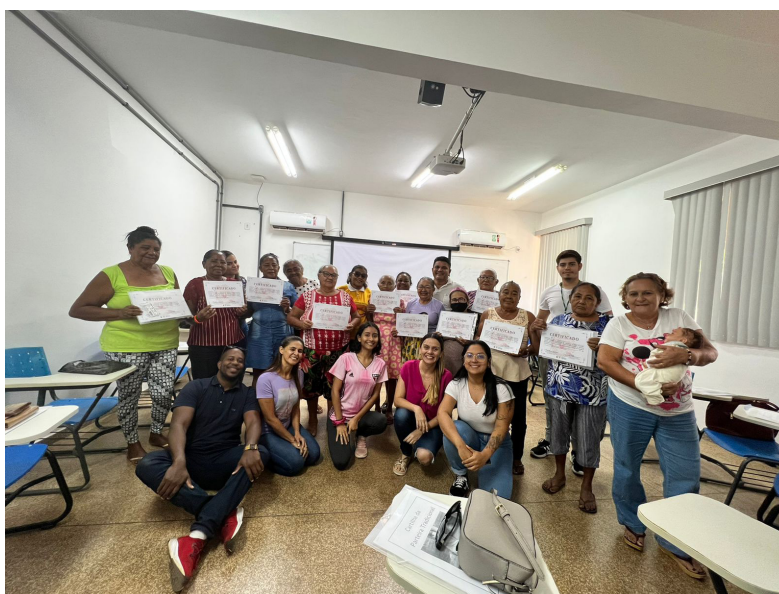
Figura 1: Parteiras tradicionais do município de Mazagão.

Os relatos das 11 parteiras que compareceram à oficina de capacitação, revelaram uma riqueza de conhecimentos e experiências passadas de geração em geração (Figura 1). Pois, destacaram a importância da transmissão intergeracional de saberes e práticas relacionadas ao parto, ressaltando a conexão intrínseca entre as parteiras e suas famílias. Para mais, muitas compartilham a influência de suas mães e avós em sua formação como parteiras tradicionais. Por conta disso, há uma necessidade que órgãos estaduais e municipais de saúde tenham responsabilidade de realizar iniciativas que registrem as parteiras ativas e ofereçam treinamento e recursos para apoiar o parto em casa, sensibilizando também os profissionais de saúde para a relevância do trabalho e história desempenhado por elas (SCHWEICKARDT et al. , 2023).