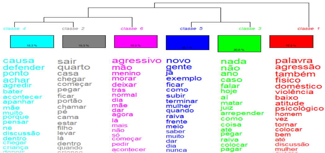
Figura 1 – Dendrograma das classes fornecidas pelo software IRAMUTEQ – Marabá, PA, Brasil, 2023.

A categoria a “palavras” e agressão na Violência Doméstica corresponde à classe 1 do Dendrograma a qual não apresenta relação direta com as outras classes, se mostrando independente. O conteúdo das entrevistas mostrou que os respondentes comumente conceituavam a violência doméstica como aquela que poderia ser realizada principalmente através das palavras, e a partir da agressão física e psicológica. Na Classe 1 do dendrograma (figura 1), o léxico “palavra” está em evidência, vale mencionar que o grupo amostral selecionado cumpria pena pelo crime de ameaça ou lesão corporal, ou ambos. A condenação criminosa por ameaça corresponde a 66,8% dos respondentes, o que explica o fato do vocábulo “palavra” aparecer com maior frequência, ilustrando que a condenação pelo ato de violência cometido pode influenciar na percepção que esses homens têm sobre Violência Doméstica (VD), salienta-se que os respondentes associavam todas às perguntas da entrevista ao seu caso particular. Um dos entrevistados conceitua que: