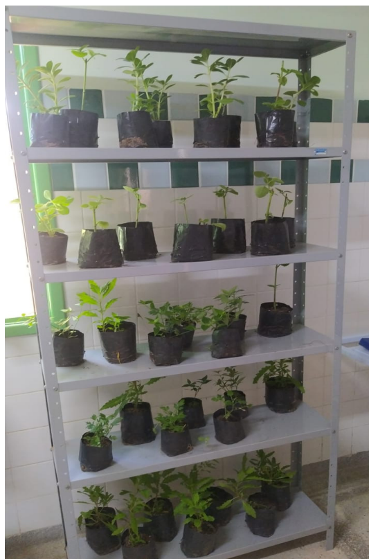
Figura 4 : Mudas de plantas medicinais para distribuição.

Ao final de cada encontro foi realizado um lanche coletivo com chás e sucos medicinais, bem como, distribuídas mudas de plantas medicinais aos participantes, visando aumentar a variedade de espécies medicinais nas residências das usuárias que participam dos encontros (Figura 4). Vale destacar que as espécies de mudas de plantas medicinais distribuídas em cada encontro são frutos de uma parceria com o Centro Municipal de Produção de Mudas de Mossoró.