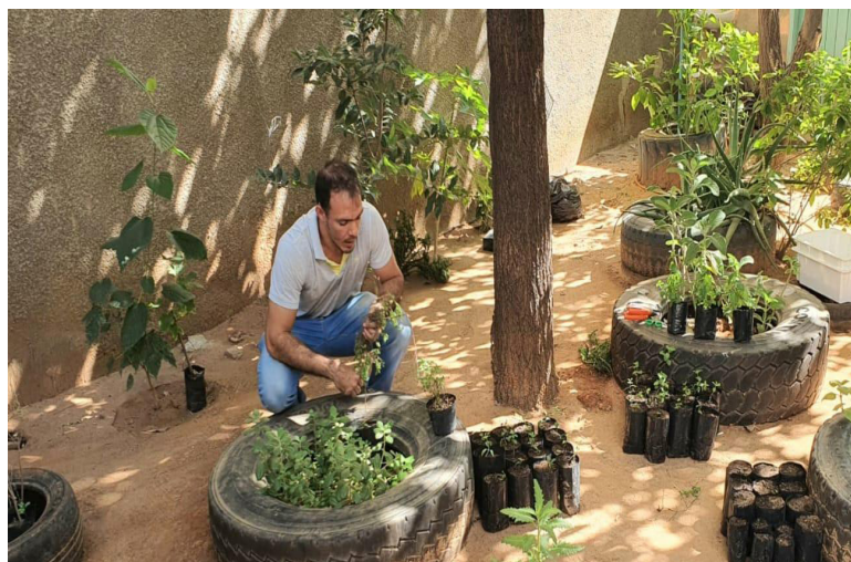
Figura 1: Horto medicinal da Unidade Básica de Saúde.