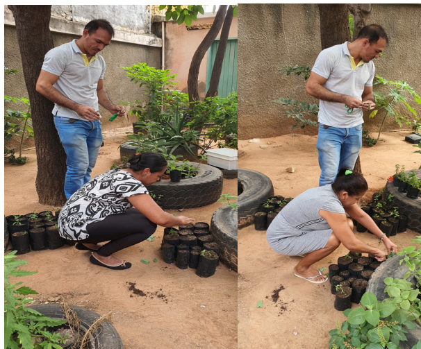
Figura 3: Participantes vivenciando a experiência de plantar.

Foi realizada uma oficina sobre as formas de cultivo das espécies medicinais de hortelã: hortelã-japonesa ( Mentha arvensis ), hortelã-pimenta ( Mentha x piperita ) e hortelã-rasteira ( Mentha x villosa ). Esta atividade foi realizada no próprio horto da UBS, onde os participantes puderam colocar a mão na terra literalmente, como uma oportunidade de protagonizar e valorizar a autonomia, conhecimentos e experiências dos usuários (Figura 3). Ressalta-se que esta iniciativa foi atendendo às solicitações da própria comunidade que demonstrou grande interesse acerca da hortelã e a equipe incluiu no leque de espécies a serem trabalhadas.