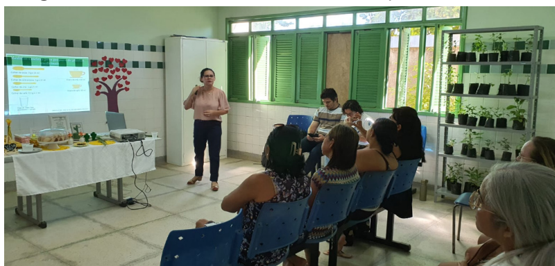
Figura 2: Roda de conversa sobre o uso de plantas medicinais.

As rodas de conversa foram realizadas no auditório da UBS como uma metodologia participativa com a comunidade atendida na unidade, estimulando e valorizando o contato e o saber dos atores envolvidos. Estas envolveram momentos, desde acolhimento, exposição dialogada, e interação com os usuários, com espaço para sugestões, dúvidas, relatos de experiências sobre como os participantes fazem o uso das plantas trabalhadas e discussão coletiva (Figura 2).