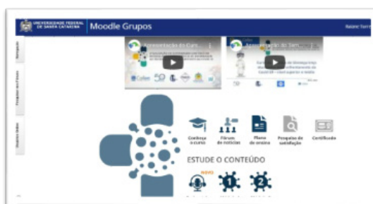
Figura 1: Tela inicial de apresentação do curso

Para obter o certificado de extensão universitária de 40 horas válido em todo território nacional, o cursista deveria obter no mínimo média aritmética 7,0, nas avaliações dos módulos. O curso foi dividido em 2 módulos. Na figura 1 vemos a tela inicial do curso, com informações referentes ao seu funcionamento.