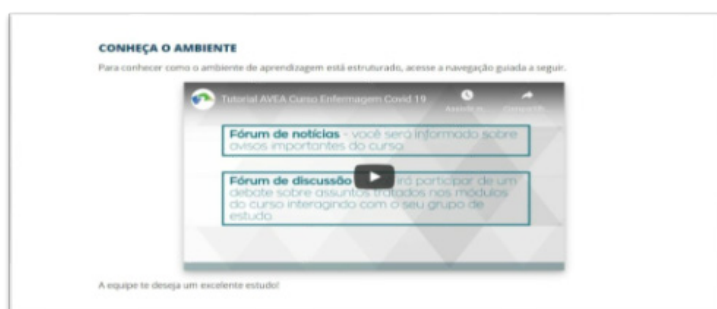
Figura 3: Vídeo sobre a COVID-19 na plataforma AVA

Os vídeos também foram utilizados na apresentação do curso, da plataforma AVA, do ambiente de estudo e da avaliação no curso, além das regras para obtenção do certificado de conclusão e como baixá-lo, assim, mesmo que o cursista nunca tivesse feito outros cursos na modalidade EaD e não tivesse familiaridade com ambientes virtuais de estudo pôde aprender como seria seu funcionamento. A figura 3 apresenta a tela inicial de um dos vídeos utilizados para apresentação do curso.