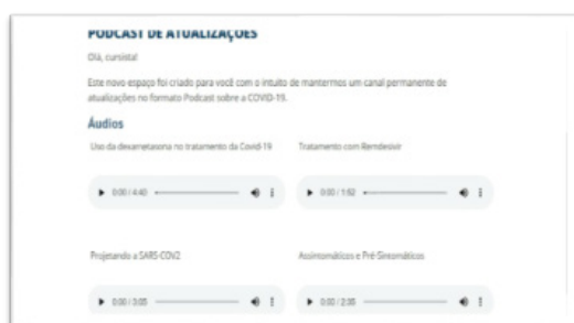
Figura 2: Podcasts sobre a COVID-19 na plataforma AVA

Durante o curso, esse recurso midiático foi usado para apresentar atualizações que não foram inseridas no material em PDF, ou que sofreram modificações, uma vez que os protocolos da Organização Mundial da Saúde (OMS) mudaram ao decorrer da pandemia. Os podcasts apresentavam curta duração (média de 3 minutos), facilitando dessa forma o entendimento da temática. Na figura 2 vemos os podcasts inseridos no AVA ao longo do curso.