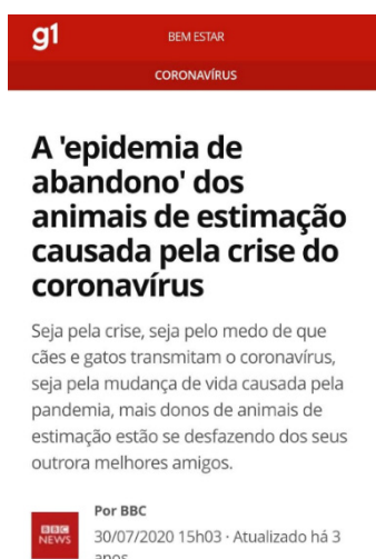
Figura 1: Epidemia do abandono de animais de estimação durante a pandemia da COVID-19.

A pandemia da COVID-19 gerou além do pânico mundial, uma crise sanitária e humanitária, causando impactos para a saúde, econômicos e sociais (Lima; Buss; Paes-Sousa, 2020). Muitos jornais brasileiros noticiaram a epidemia do abandono de animais de estimação, cães e gatos, os maus-tratos aumentaram no país, pois os tutores estavam apreensivos de que cães e gatos transmitissem o vírus, conforme a Figura 1.