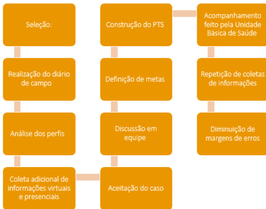
Figura 01: Fluxograma das etapas de elaboração do PTS

Este estudo faz parte de projeto aprovado pelo Comitê de Ética e Pesquisa em Humanos (CAAE: 65680922.7.0000.5587).