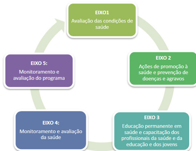
Figura 1- eixos do Programa Saúde da Escola.

Segundo Lopes, Nogueira e Rocha (2018) o Programa Saúde na Escola (PSE) deve ser operado considerando os cinco eixos representados na figura a seguir: