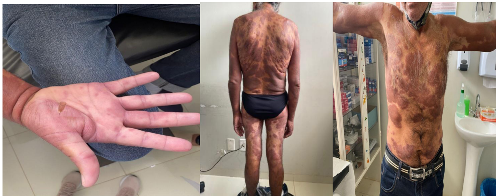
Figura 1, 2 e 3: lesões hansênicas anestésicas

Foi pedido a ACS informar todos os contactantes, a importância de passarem por avaliação também. Esse paciente continuará sendo acompanhado pela nossa equipe em todo seu tratamento. Mas o principal foco desse artigo foi mostrar formas não convencionais de apresentação clínica no diagnóstico, visto que a hanseníase ainda é uma doença muito prevalente em nosso país e muito heterogênea.